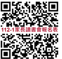
112-1家長讀書會報名表