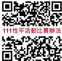
(111 性平活動比賽辦法)