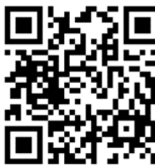
6 月 9 日國九志願選填說明會報名