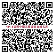
111-1 華興中學家長讀書會報名表