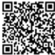
流感疫苗 60 秒全圖(衛生局)